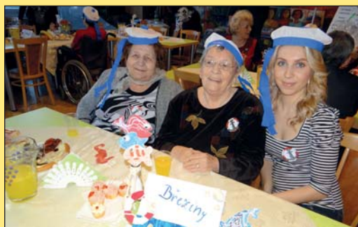
Námořnický ples - Domov Vesna, Orlová 20. 2. 2014