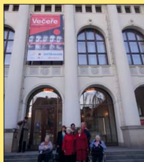
Návštěva představení v divadle A. Dvořáka, Ostrava 12. 11. 2014