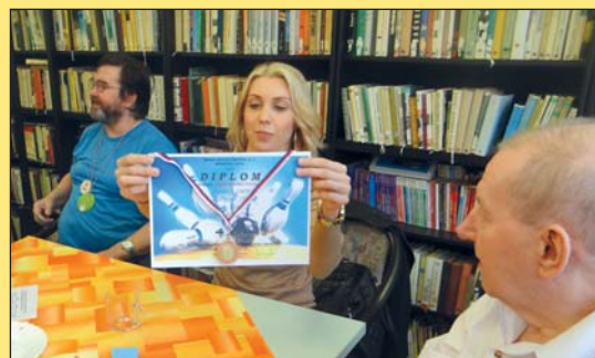
Soutěž v kuželkách, Domov Luna, Havířov 14. 10. 2014