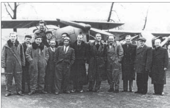
Členové „AERO KLUBU“ v Petřvaldě v roce 1948