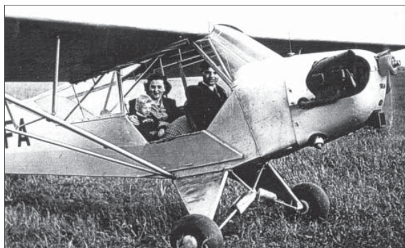
Vyhlídkový let nad Petřvaldem v roce 1949