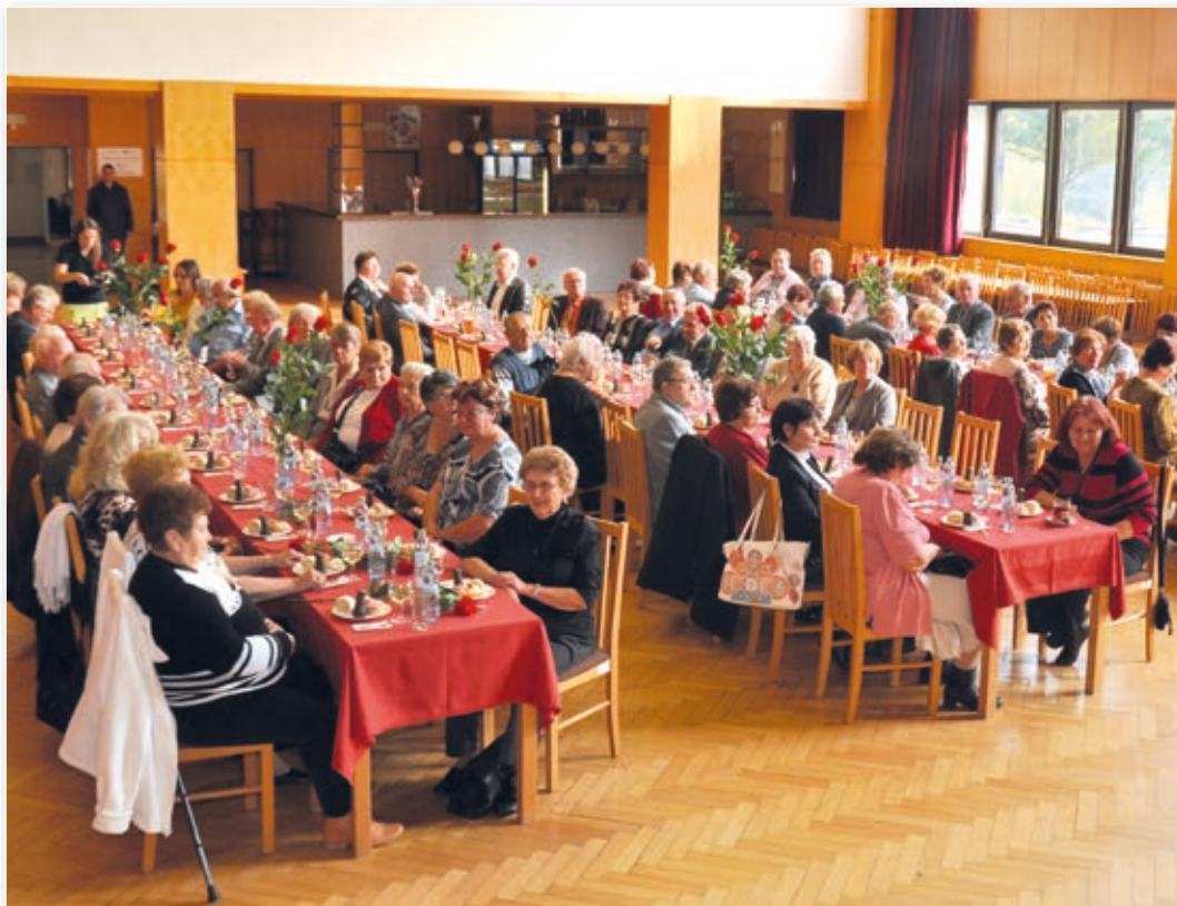
Slavnostní setkání s jubilanty