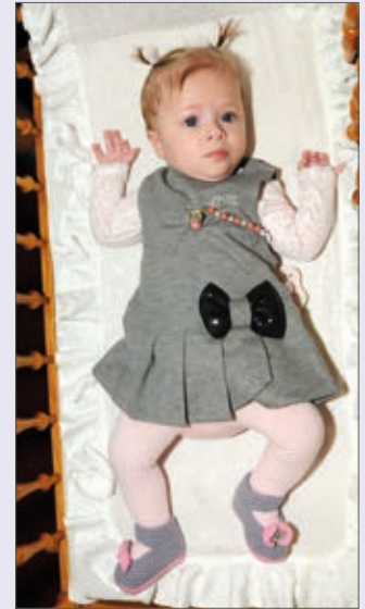
Valerii Terezu Hánovou