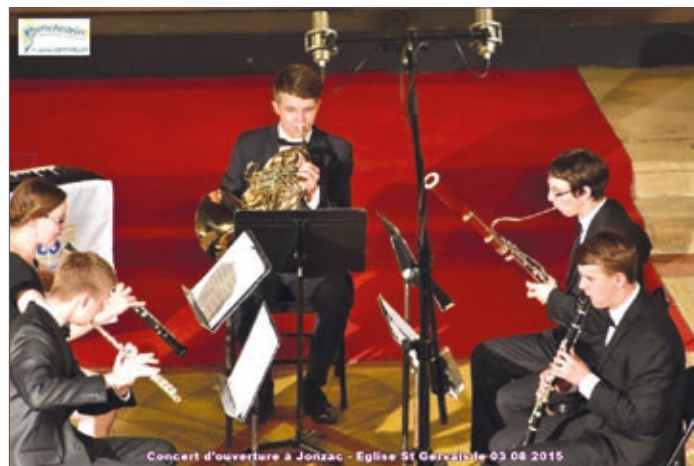
Concert d'ouverture à Jonzac - Eglise St Germain le 03 08 2015

V neděli 13. 12. 2015 v 15:00 hodin vystoupí a zahraje v kostele sv. Jindřicha Moravian woodwind quintet (Moravské dechové kvinteto). Přednese tyto skladby: C. M. Schönberg - Les Misérables (suite), G. Bizet - Carmen (suite), P. I. Čajkovskij - Louskáček (suite) Srdečně vás zveme k zastavení a příjemnější si adventního odpoledne. Vstupné dobrovolné. Výtěžek koncertu bude věnován na podporu maminek v tísní.