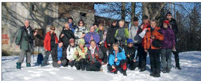
Akce 14. 2. 2015