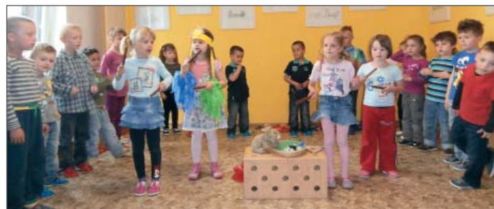
Děti z MŠ Šenovská