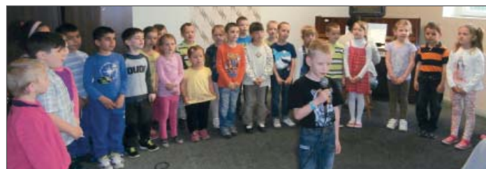
Děti z MŠ 2. května