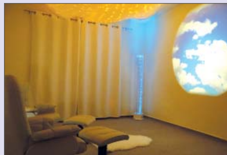
Relaxační místnost Snoezelen v Domově Březiny