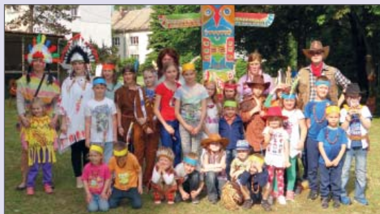
Den dětí v Domově Březiny - 29. 5. 2015