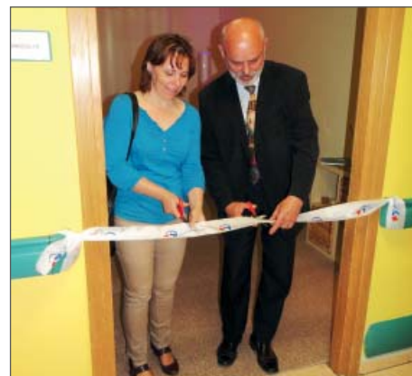
9. 6. 2015 - Slavnostní otevření místnosti snoezelen