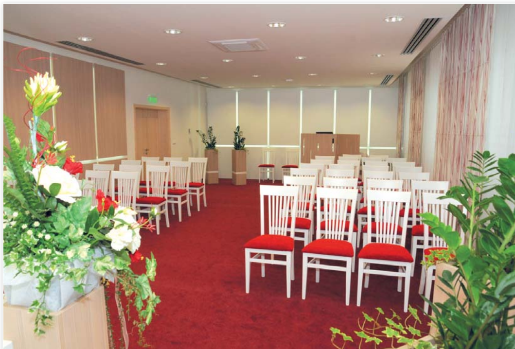
Obřadní síň v nové budově radnice.