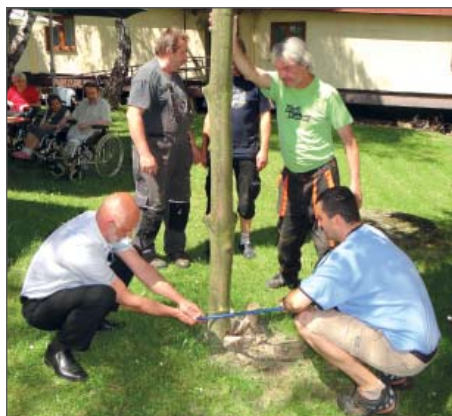
3. 6. 2015 - Kácení májky