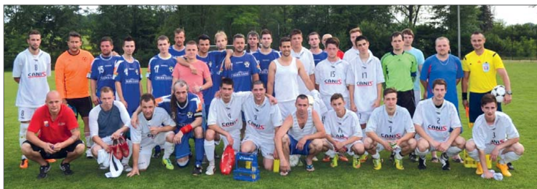
Hráči Slavoj a Hepa po skončeném mistrovském utkání