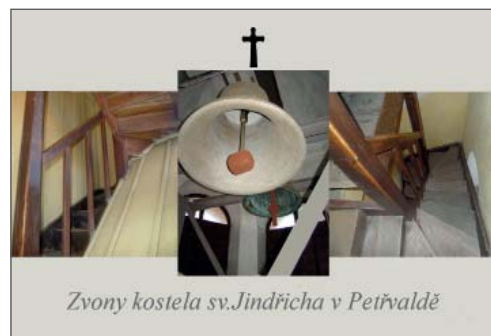
Zvony kostela sv. Jindřicha v Petřvaldě

Po zániku kostela svaté Barbory na místním hřbitově v roce 1835 započala výstavba kostela sv. Jindřicha, křížové cesty s kapličkami a kamenných soch světců a světic Marie a Hedviky. Vznikl tak architektonicky vyvážený soubor památek, kterým vévodí jedinečná poloha kostela na vyvýšeném místě v krajině. Od Ostravské ulice ke