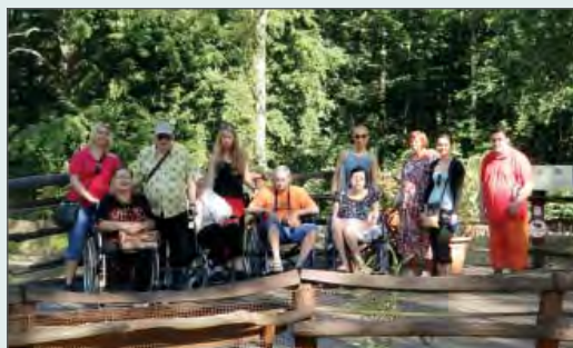
Návštěva ZOO Ostrava

Následujícího dne (2. července) jsme se sedmi uživateli podnikli v dopoledních hodinách výlet do ostravské ZOO. Jen díky