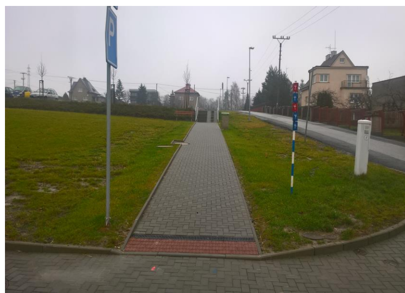
Chodník podél ul. Školní