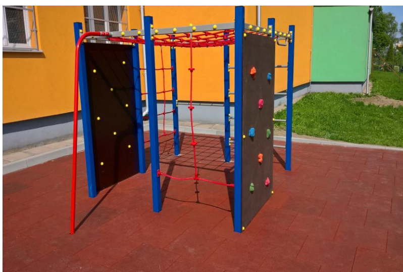
Realizace dětských prvků na hřišti u ZŠ Školní