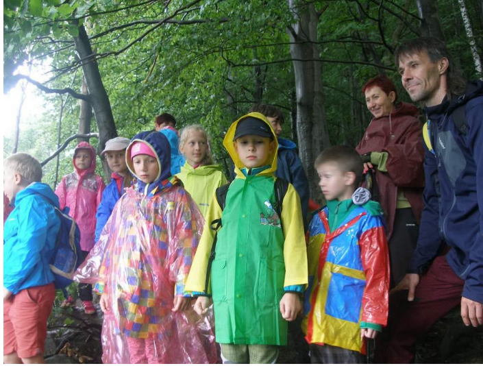
Výlet na Lysou horu