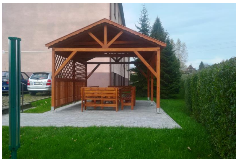
Altánek u domů s pečovatelskou službou na ul. Ráčkova