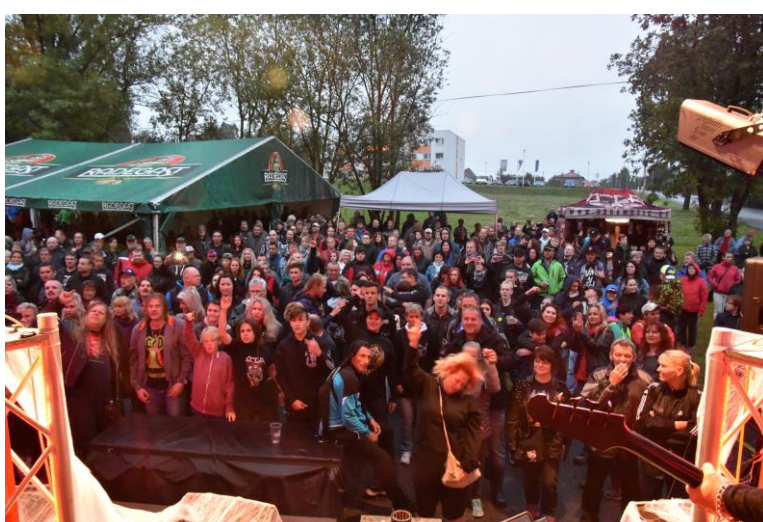
Petřvaldský letní otvírák