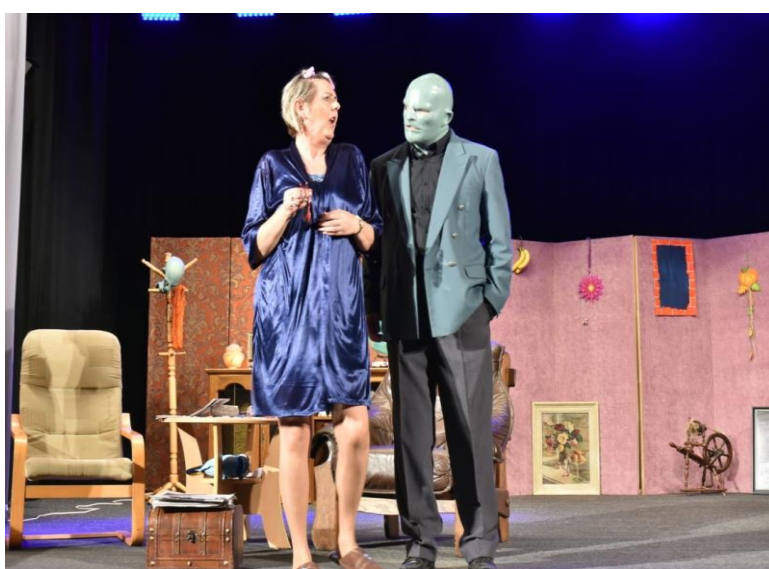
Víkend s amatéry