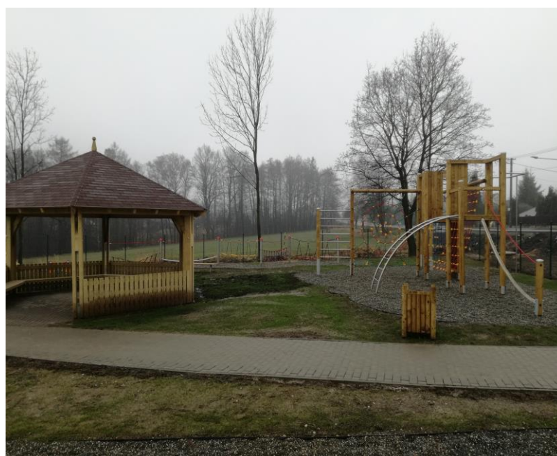
Výstavba víceúčelového hřiště na ul. Šumbarská