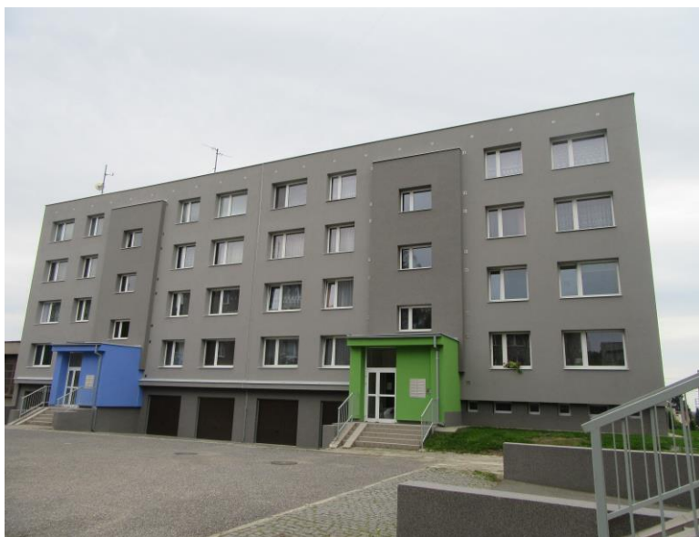
Realizace energetických úspor byt.domů na ul. Březinská

Byly provedeny sadové úpravy u domu s pečovatelskou službou č. p. 1738 a v této lokalitě bylo rovněž postaveno pro nájemníky DPS nové zastřešené venkovní posezení. V sále kulturního domu bylo instalováno nové promítací plátno a bude zde probíhat filmová produkce pro děti a dospělé. Z kulturních a sportovních akcí připomínáme Petřvaldský otvírák, Den tradic, Dětský den u sokolovny, Olympijský den na HEPU, letní kino, Den pro psy, divadelní Víkend s amatéry, Adventní jarmark, příměstský tábor a mnohé další.