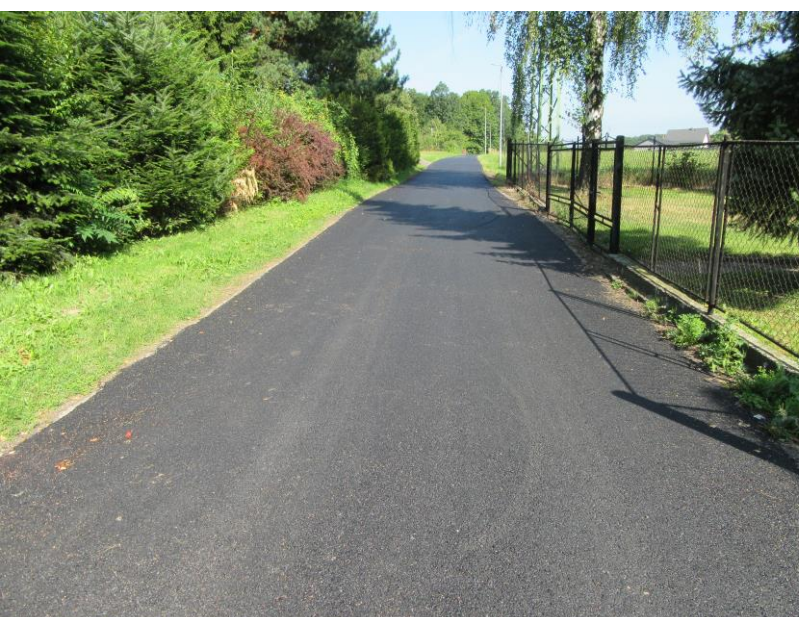
Opravy místních komunikací