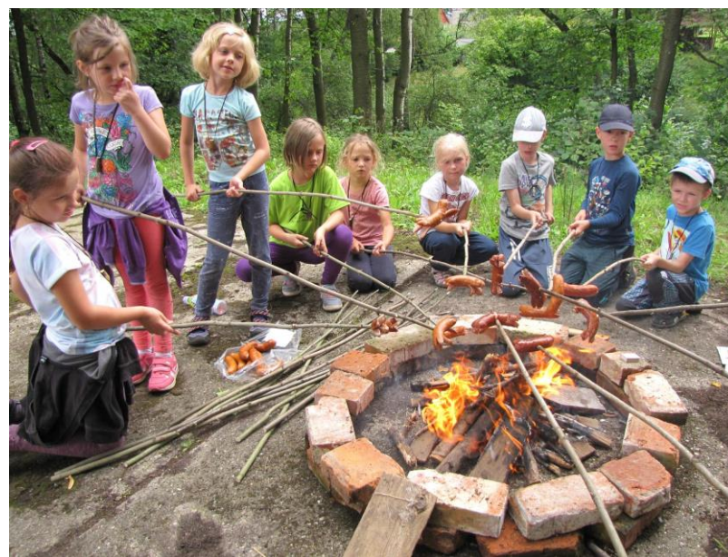
Letní příměstský tábor