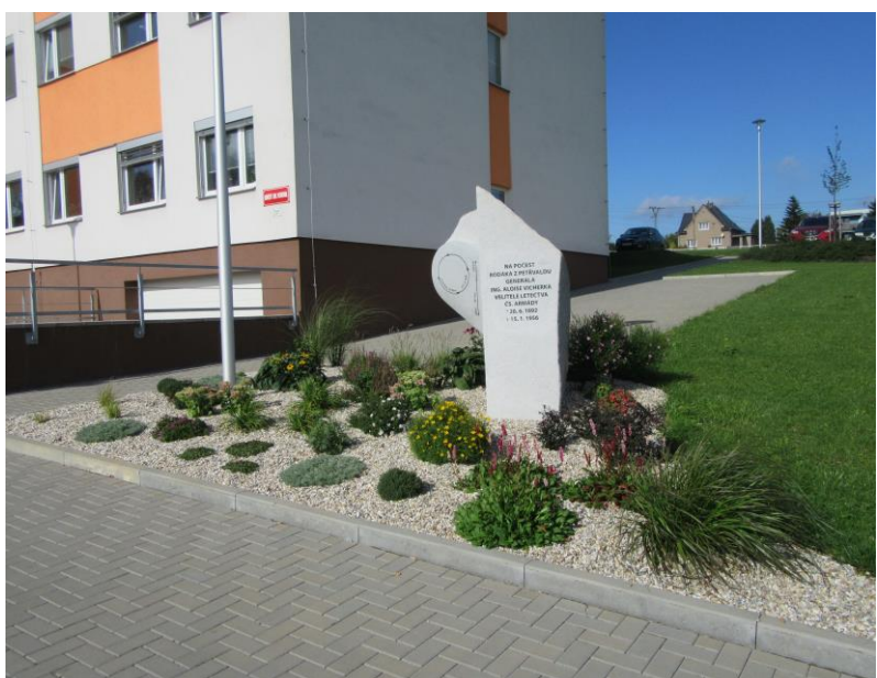
Sadové úpravy u radnice a památník Gen. Vicherka