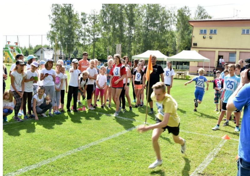
Sportovní den na TJ Hepo Petřvald