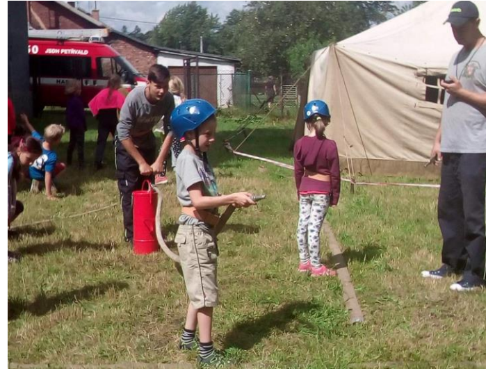
Den s hasiči