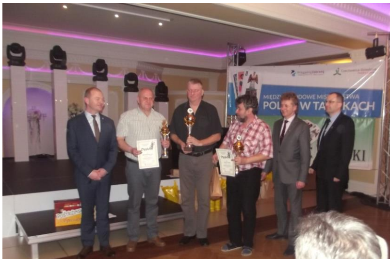
Slavnostní vyhodnocení výsledků Grand Prix Slezska.