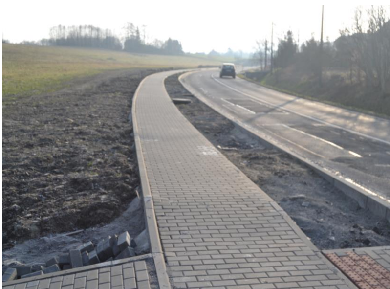
Chodník podél ul. Šumbarská