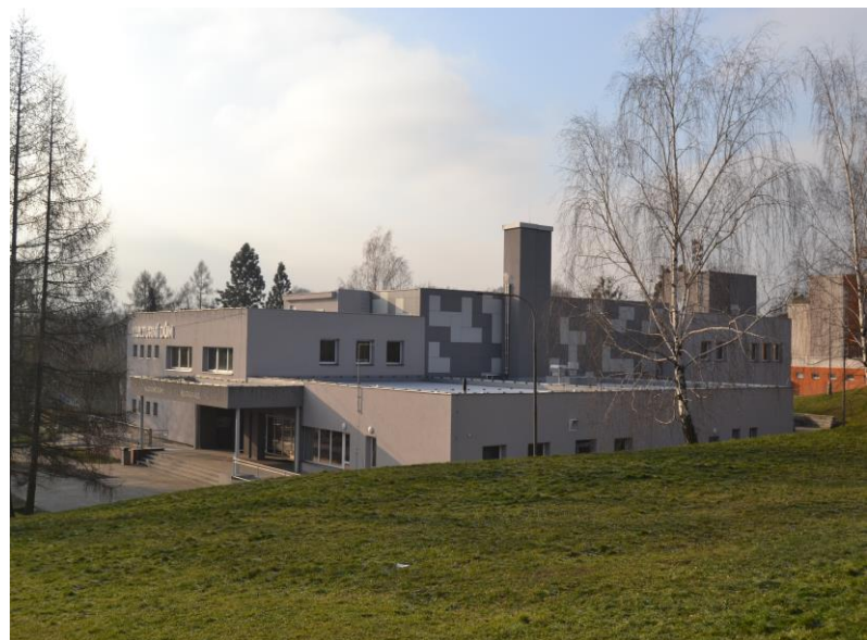
Realizace energetických úspor kulturního domu