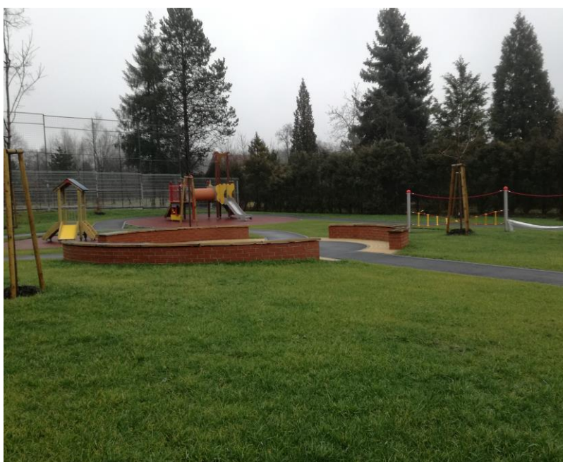
Rekonstrukce školní zahrady MŠ na ul. Šenovská