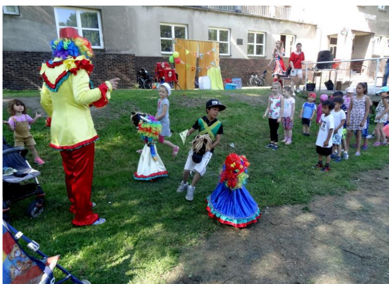
Dětský den u Sokolovny