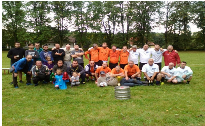
Účastníci turnaje: zleva FC Zaryje, vítězný tým TJ Sokol a HEPO.