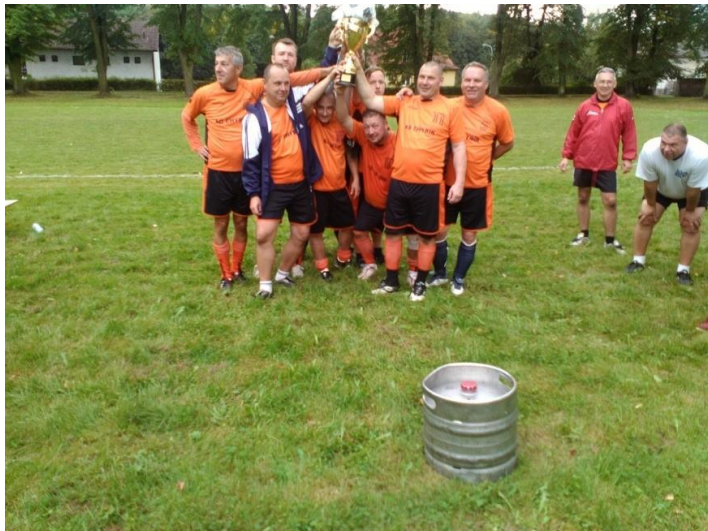
Vítězný tým TJ Sokol Petřvald s pohárem.

Dne 2. září 2017 se od 14. hodin v areálu naší sokolovny konal 1. ročník turnaje „O putovní pohár starosty Sokola Petřvald“ v malém fotbalu. Turnaje se zúčastnily týmy domácího TJ Sokol, HEPA a FC ZARYJE. Po dohodě se zástupci jednotlivých týmů rozhodl hlavní rozhodčí a hlavní pořadatel turnaje v jedné osobě J. Němec, že se bude hrát dvoukolově každý s každým a s upravenými časy jednotlivých hracích období. Letos byl pro vítěze připraven opět soudek zlatavého moku, ale také krásný pohár. Vítězem tohoto nově zrozeného turnaje se nakonec stali borci z TJ Sokol Petřvald, na druhém místě se umístil tým FC Zaryje a třetí byli hráči z HEPA. Věříme, že dalších ročníků se zúčastní více týmů a ještě hojnější počet diváků než letos. Chtěl bych touto cestou poděkovat vedení města Petřvaldu za finanční podporu pro nákup cen.