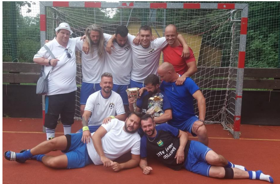
Vítěz poháru SK Slavoj Petřvald

SK Slavoj Petřvald se zúčastnil turnaje v malé kopané v malebném místě Beskyd v Dolní Lomné. Z pěti zápasů čtyři vyhrál a jednou remizoval a stal se celkovým vítězem turnaje. Odvezl si domů putovní pohár a spoustu krásných zážitků.