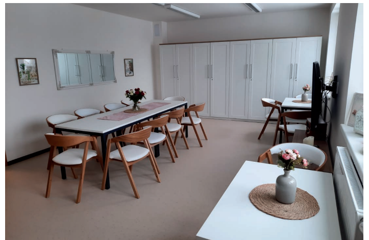
Modernizovaný Domov Březiny v Petřvaldě.