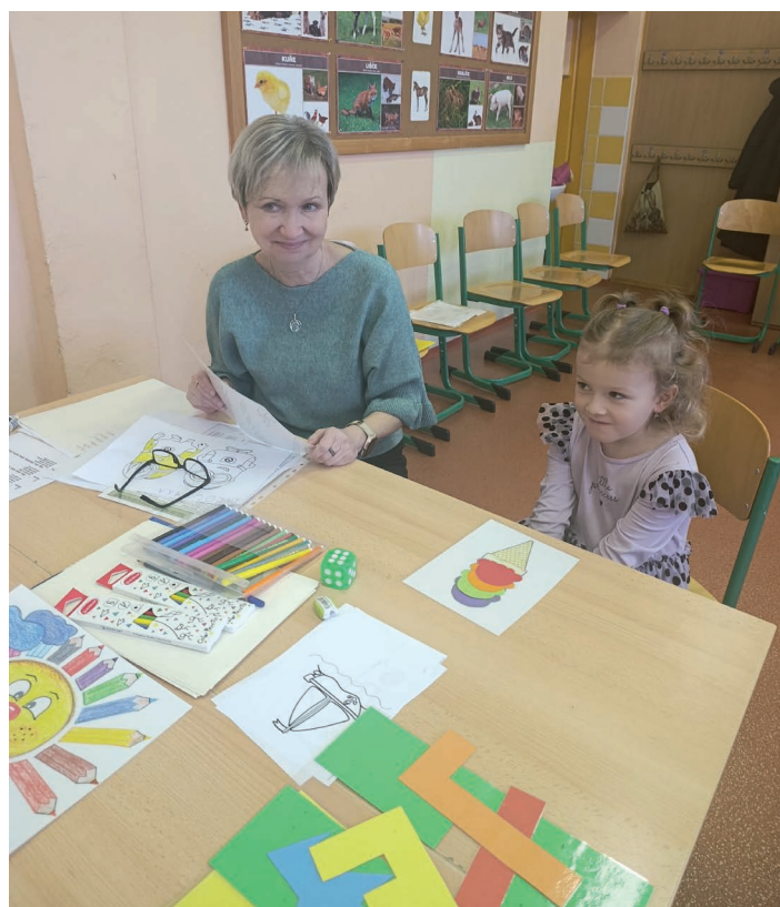
Zápis do 1. tříd v Petřvaldě.