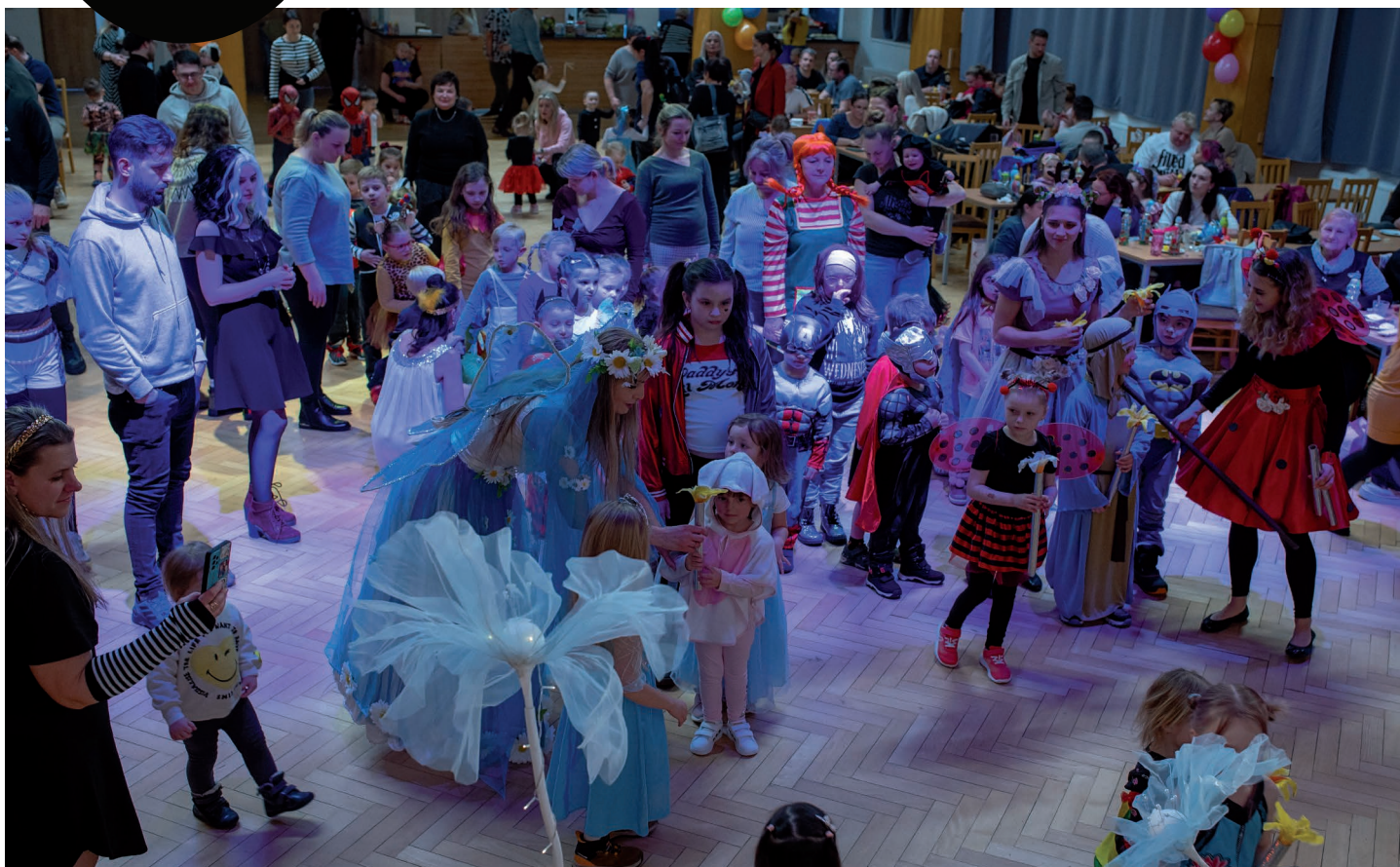
V našem kulturním domě se uskutečnil dětský karneval. Více na str. 4.

Termín uzávěrky dalšího vydání Petřvaldských novin je 18. března 2026 ve 12.00 hod. Termíny uzávěrek dalších čísel novin jsou zveřejněny na www.petrvald-mesto.cz