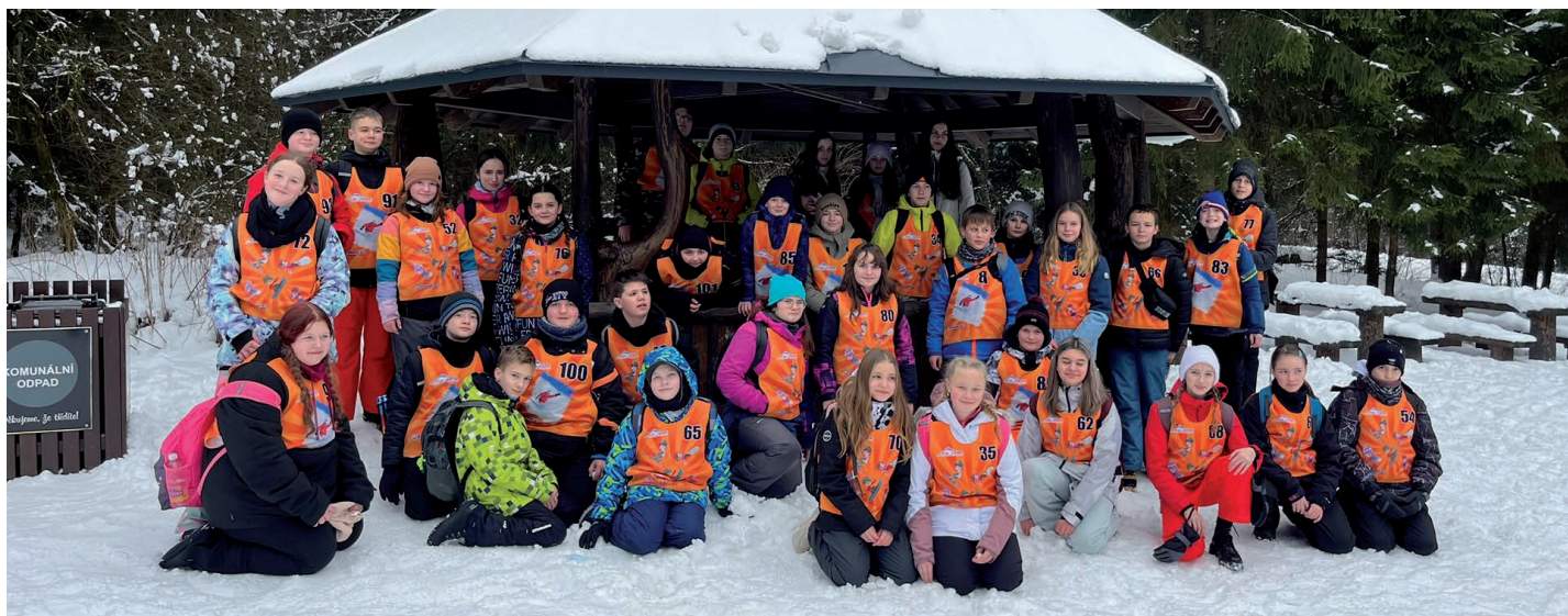
Účastníci lyžařského výcviku na Bílé.