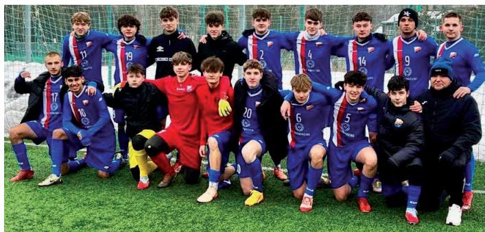
dorost TJ Petřvald