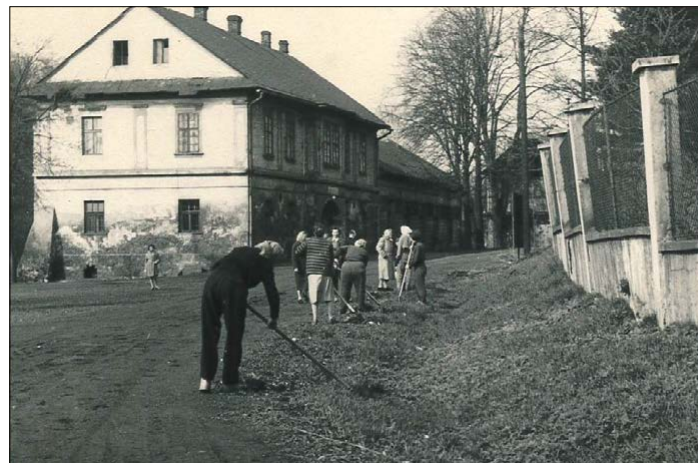
Udržovací práce na cestě směrem k tramvaji, plot nynější spořitelny.

Chtěli bychom vás touto cestou požádat, zdali byste ve svých rodinných albech nenašli dobové fotografie z různých historických období, na nichž